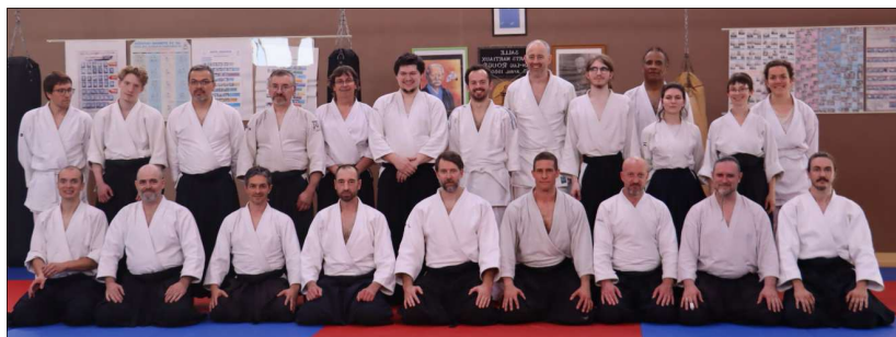
Les pratiquants présents lors du week-end du 31 mai.

Cette année marquée sous le signe de la progression a vu le passage de grade de nombreux membres du club, auxquels nous adressons nos plus sincères félicitations et que nous encourageons à continuer dans cette voie :