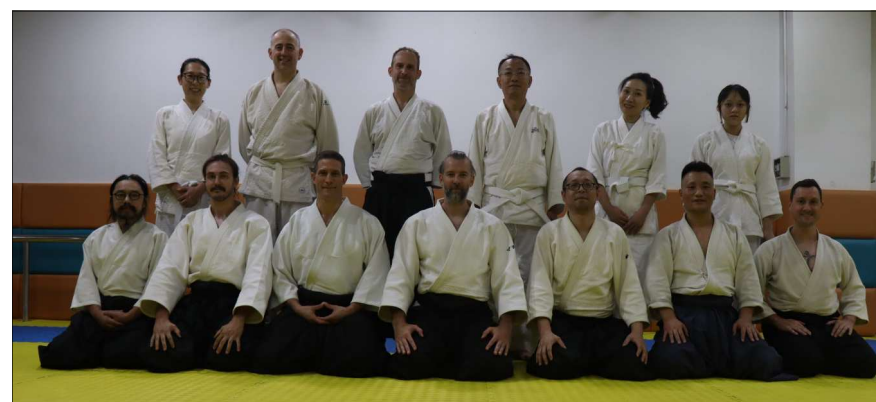
Stage d'octobre 2025 en Chine.