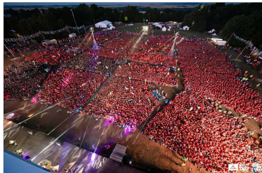
Jamboree des 14-17 ans à 18 000 personnes (du 24 au 28 juillet 25)