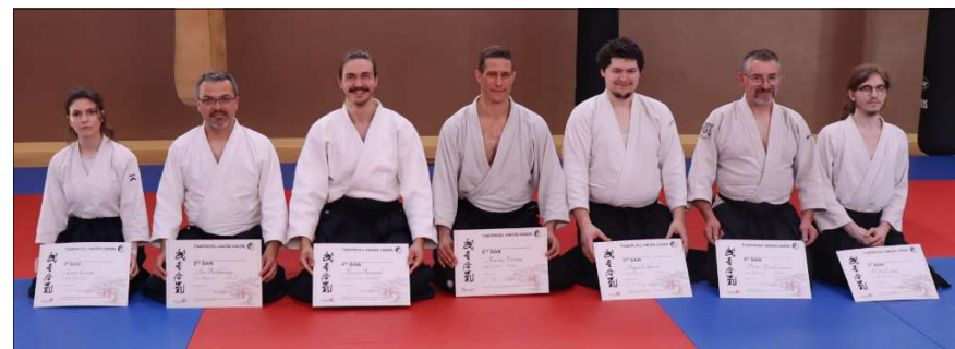
Les diplômés Takemusu Aikido Union, dont trois membres de Mirecourt