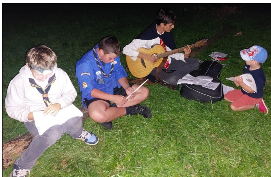
Veillée, contes et chants autour du feu au WE de rentrée (septembre 25)

Après une année et un été riches en souvenirs, le groupe scout de Mirecourt a repris ses activités avec un week-end campé de découverte, ouvert à tous, organisé à Ville-sur-Illon. Ce temps fort a permis d'accueillir de nouveaux jeunes dans une ambiance conviviale, entre repas cuisinés au feu de bois, veillées animées et moments de partage.